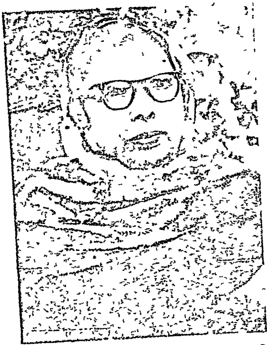
श्री महादेवी वर्मा